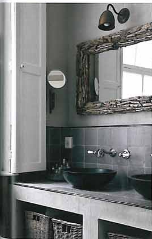
Foto links: een van de blikvangers in de badkamer is de zelf-gemaakte spiegel, gemaakt met stukjes hout die de kinderen op vakantie in Frankrijk verzameld hebben. Foto midden: door middel van Dons lijfspreuk ‘C’est la vie!’ op de muur en Leonieks trouwjurk, is de ouderlijke slaapkamer een zeer persoonlijke ruimte geworden. De kroonluchter komt van een Brusselse rommelmarkt. Door de neutrale tinten is het contrast met vroeger, toen de vloer van deze ruimte nog paars was en het plafond geel, groot.

Een gedeelte van de kelder is door middel van een gezamenlijk idee als verrassing voor de verjaardag van Don omgebouwd tot wijnkelder. In het andere deel van de kelder worden interieurworkshops gegeven onder de naam ‘Ontdek je eigen stijl’. Gedurende drie uur gaan de deelnemers aan de slag met magazines en stalen, met als eindresultaat een moodboard dat de stijl weergeeft die helemaal in de smaak valt. ■